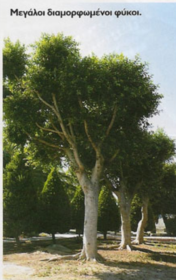
Μεγάλοι διαμορφωμένοι φύκοι.

η ελιά, η χαρουπιά, το πεύκο, ο τρέμιθος, η μοσφιλιά, τα κυπαρισσοειδή, η κάπαρη, η ακακία και πολλά άλλα.