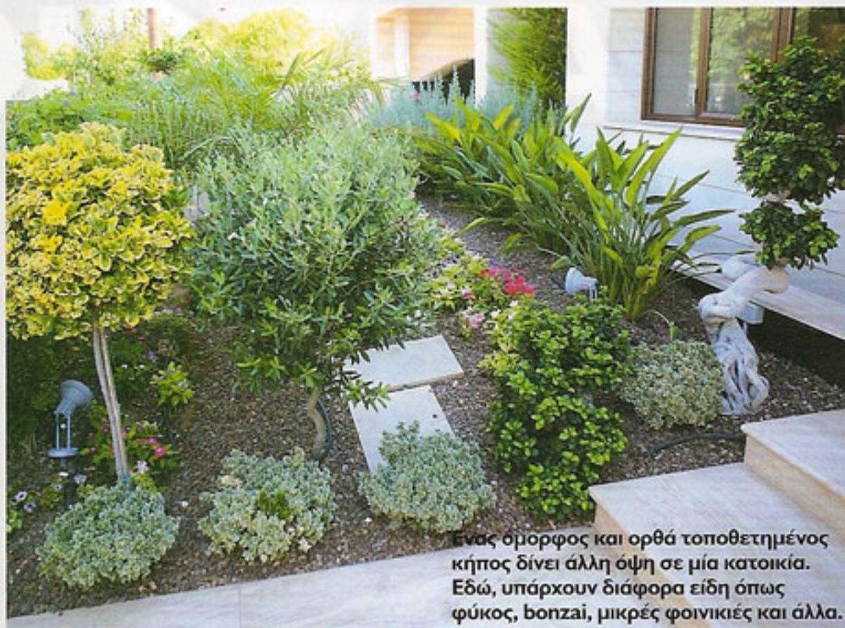
Ένας όμορφος και ορθά τοποθετημένος κήπος δίνει άλλη όψη σε μία κατοικία. Εδώ, υπάρχουν διάφορα είδη όπως φύκος, bonzai, μικρές φοινικιές και άλλα.